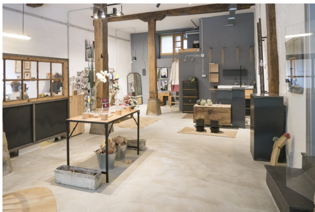
Ganboa Jewellery (Aretxaga, 5)

En 2018, elle crée sa première collection de vêtements femmes et de bijoux. Tous les vêtements sont réalisés entièrement à la main et sur commande. Les commandes sont toutes personnalisées et laissent au client une place centrale dans le processus de création.